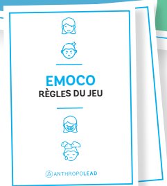
Livret Règles du jeu